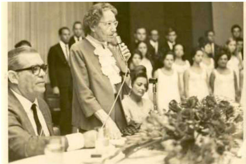
Figura 01: Dona Helena Antipoff discursando

Helena Wladimirna Antipoff (transliteração do cirílico Елена Владимировна Антипова), a notória Helena Antipoff (Grodno, 25 de Março de 1892 — Ibité, 09 de Agosto de 1974) foi uma psicóloga e pedagoga russa que após conseguir formação universitária na Rússia, Paris e Genebra, se fixou no Brasil a partir de 1929, atendendo a solicitação do governo do estado de Minas Gerais, na conjuntura da operacionalização da melhoria da educação popularmente designado como Reforma Francisco Campos-Mário Casassanta. Grande pesquisadora e docente da criança deficiente, Helena Antipoff (Figura 01) foi precursora na iniciação da educação especial no Brasil, onde constituiu a primeira Sociedade Pestalozzi, começando o movimento pestalozziano brasileiro, que conta, hoje em dia com cerca de 100 estabelecimentos. Seu trabalho no Brasil é permanecido pela Fundação Helena Antipoff, na localidade de Fazenda do Rosário. o Distrito de Helena Antipoff (Canal de Ibité) a ser criado será formado pelos bairros: Canaã 2ª Seção, Canal de Ibité, Canoas 1ª Seção, Helena Antipoff, Industrial Ibité, Jardim das Oliveiras 3ª Seção, Jardim das Rosas, Jardim Industrial 2ª Seção, Jardim Montreal, Jardim Rosário, Lago Azul 1ª Seção, Ouro Negro, Petrovale 2ª Seção, Quintas da Jangada 1ª Seção, Recanto da Lagoa 1ª Seção, Represa Ibité, São Pedro 5ª Seção, Vila Escorpião, Vila Jaçanã, Vila Nunes e Vila Rosário.