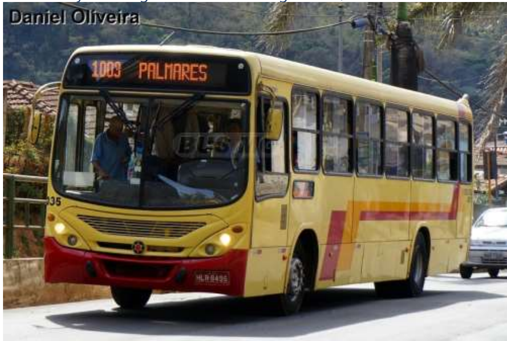
Figura 03 - Layout antigo da linha 1003 Lagoa Azul/ Retorno Circular Palmares